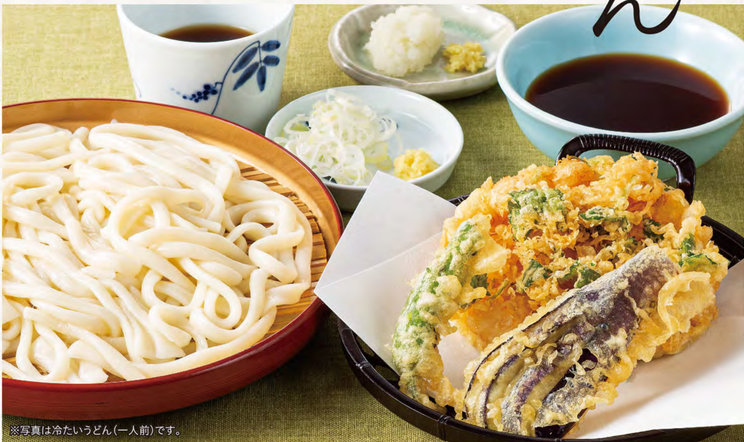
※写真は冷たいうどん(一人前)です。